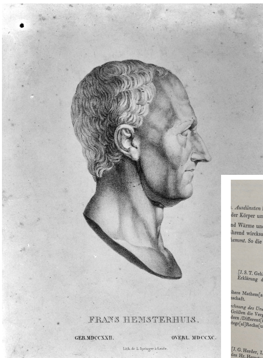
Frans Hemsterhuis (1721-1790)

Novalis's Hemsterhuis Studies in the historical critical edition of his works